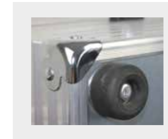
verchromte Ecken + Bodennagel