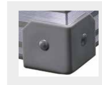
Kunststoff-Ecken in grau