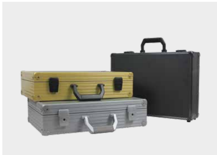
Spacelab-System, Profile können wir in allen RAL-Farben pulverbeschichten