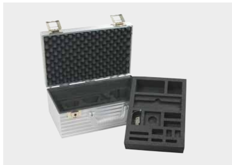
Spacelab-System mit maßgefertigter, gefräster Hartschaumstoffeinlage