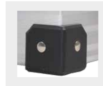
Kunststoff-Ecken in schwarz