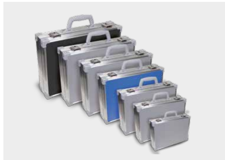
Spacelab-System, in verschiedenen Größen herstellbar