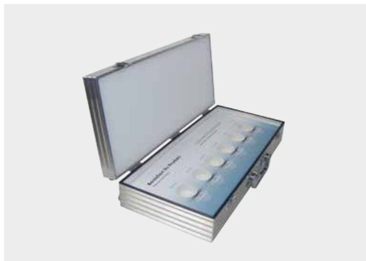
Spacelab-System mit folienkaschierter Platte und Aussparungen für Musterkugeln