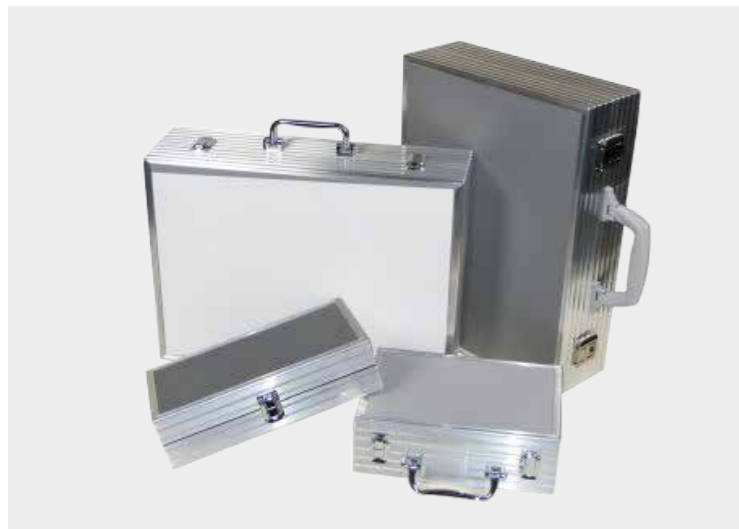
Spacelab-System, Seitenplatten aus Kunststoff in silber, schwarz, weiß und carbon-optik möglich