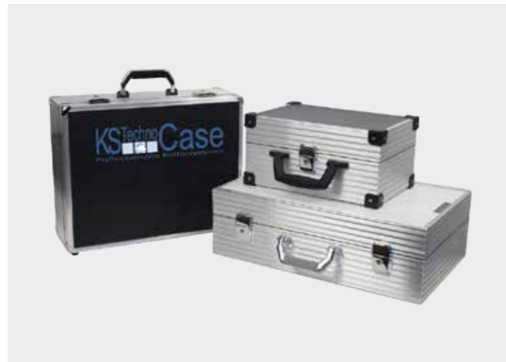
Spacelab-System mit verschiedenen Griffen und Schlössern, Logodruck in Sieb- und Digitaldruckverfahren