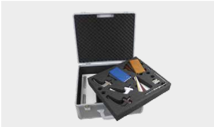
SLX-System mit maßgefertigter Schaumstoffeinlage