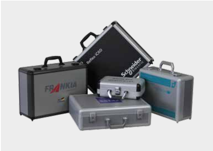
SLX-System mit Bedruckung