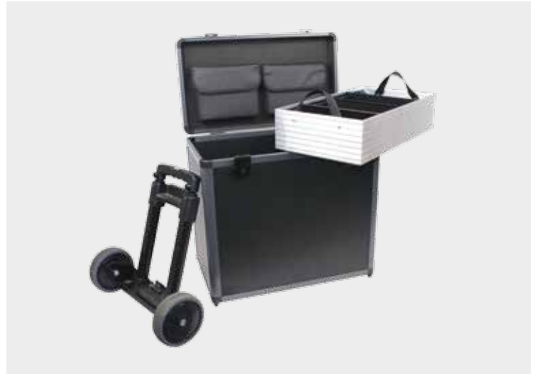
SLX-System in Pilotenform mit Deckeltaschen und abnehmbarer oder fester Trolleyfunktion