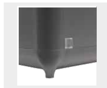
Kunststoff-Ecken in schwarz mit kleinen Bodennagel klar