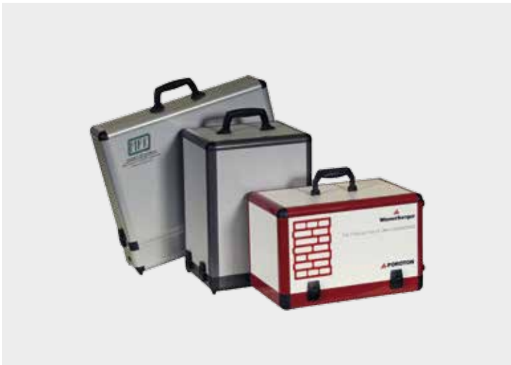
SLX-System als Haubenkoffer mit bunten Profilen