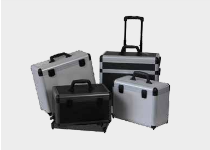
SLX-System als Präsentationskoffer mit Trolley