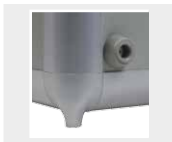
Kunststoff-Ecken in grau mit Bodennagel