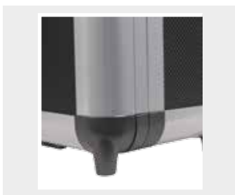
Kunststoff-Ecken in schwarz