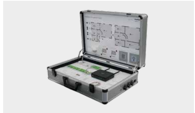
SLX-System als Programmierkoffer inkl. elektrische Verdrahtung und gefräster, bedruckter Einbauplatte