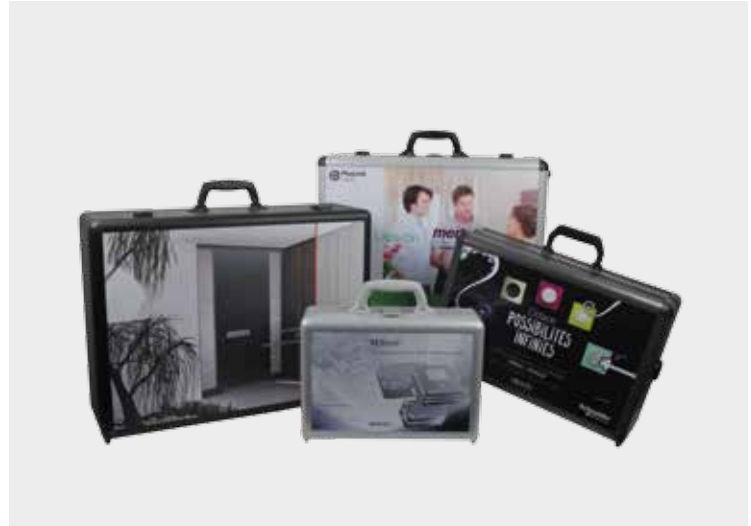
SLX-System mit folienkaschierter Bedruckung