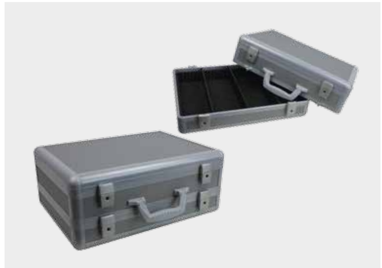
SLX-System als Etagenkoffer