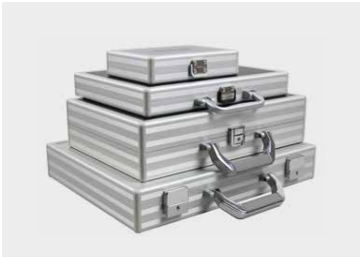
Slimline-System mit verschiedenen Griffen und Schlösser möglich