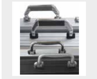
verschiedenen Griffe möglich