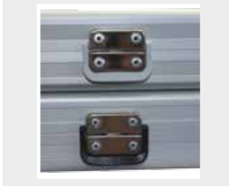
Bügelverschluss in grau oder schwarz möglich