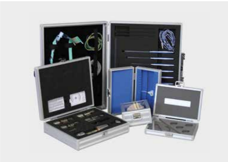
Slimline-System mit individueller Schaumeinlage Deckel aus Plexiglas möglich