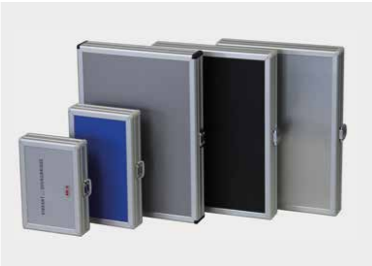
Slimline-System mit verschiedenen Außendesigns möglich