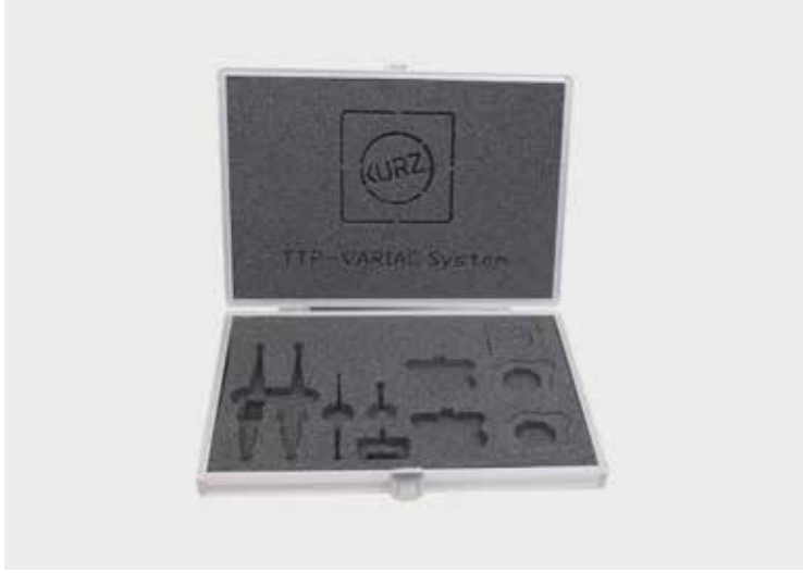
Slimline-System mit Schaumeinlage die wasserstrahl geschnitten wird