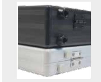
verschiedene Kunststoff-Bodenfüße möglich