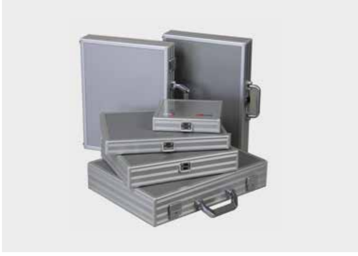
Slimline-System als Akten- oder Präsentationskoffer