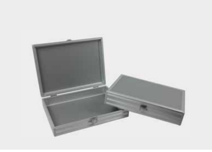
Slimline-System mit hohen Kastenprofil und schmalen Deckelprofil

Unser Slimline-System zeichnet sich durch Wertigkeit und Exklusivität aus und eignet sich daher hervorragend als Präsentationsetui oder Mappe.