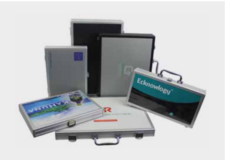
Slimline-System in Sieb-Digitaldruck, wie folienkaschierte Seitenplatte möglich