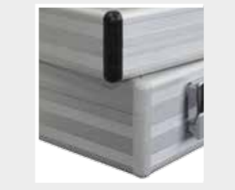
Kunststoffecken in schwarz oder