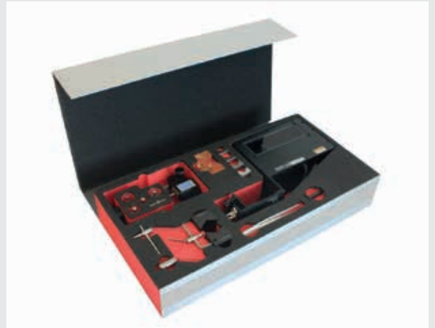
Dynamic-System mit farbiger Schaumeinlage