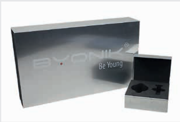
Dynamic-System mit Logoaufdruck