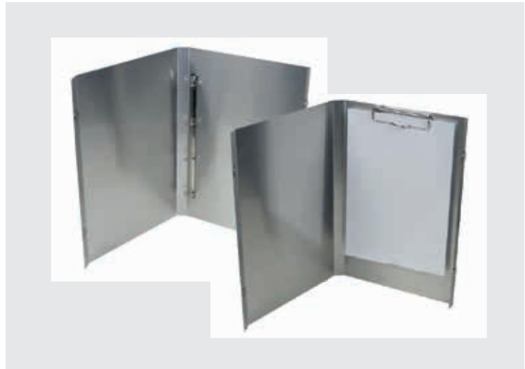
Dynamic-System mit Ringbuchhalterung