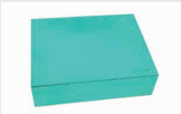
Dynamic-System mit farbiger Außenseite