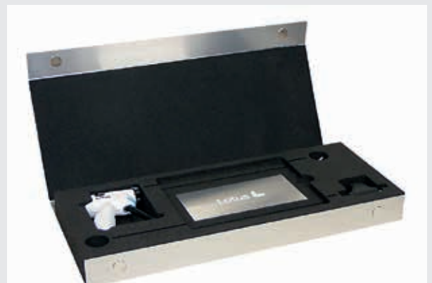
Dynamic-System mit wassergestrahelter Schaumstoffeinlage