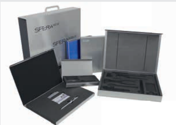
Dynamic-System mit individueller Schaumstoffeinlage in Digital- oder Siebdruck Verfahren möglich