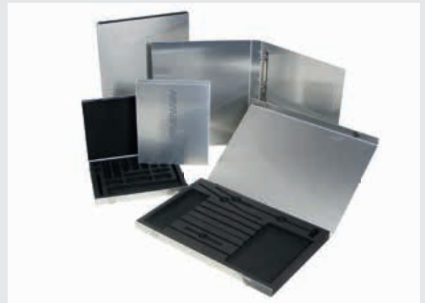
Dynamic-System als Präsentationsetui