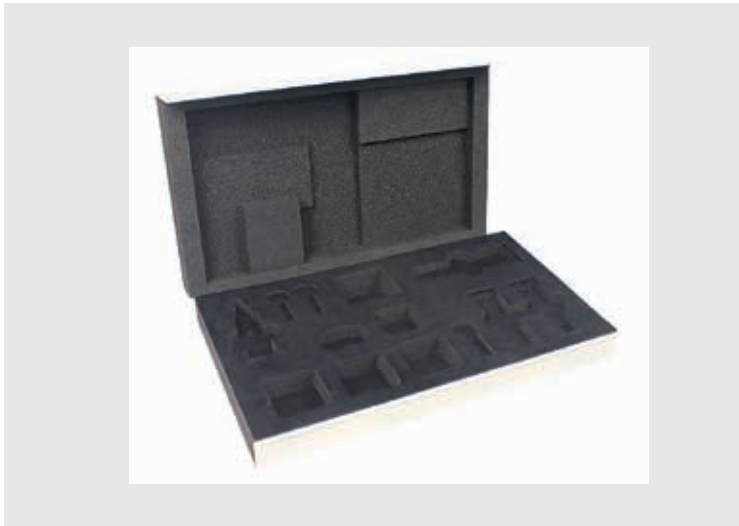
Dynamic-System mit wassergestahlter Schaumstoffeinlage, mit edlem farbigen Nerze überzogen